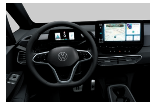
Multifunktionslenkrad in Leder, beheizbar, mit Touch-Bedienung.