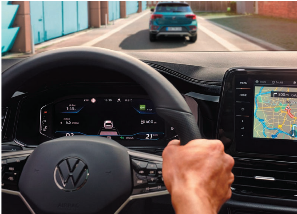
Digital Cockpit Pro.