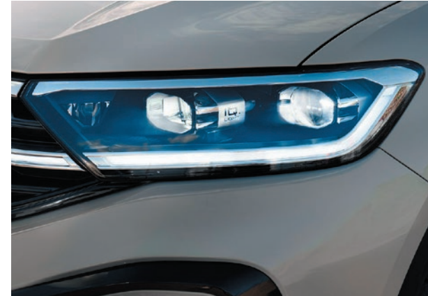
IQ.Light - LED-Matrix-Scheinwerfer.